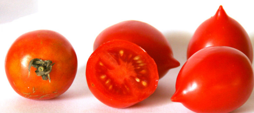
Bombeta de Caldes