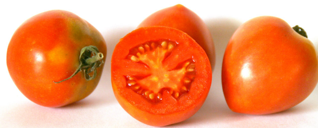
Cirerol de Caldes