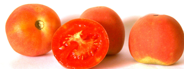
Mala Cara de Riells