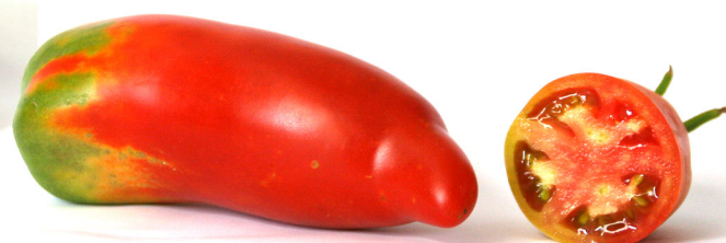
Nas de Bruixa