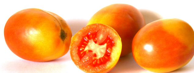
Penjar de Can Mataporcs