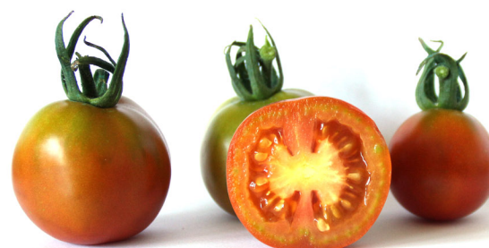
Penjoll de Can Po